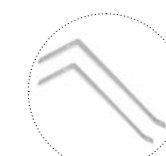
Крепление для школьных досок